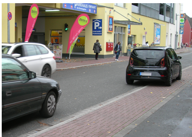
Abbildung 2: Gehwegparker sind in der Straße »Am Kronengarten« keine Seltenheit